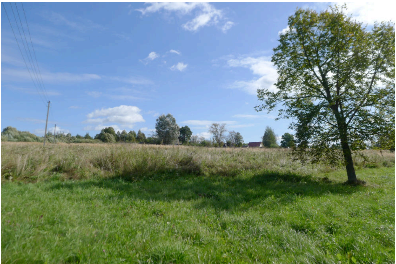
Фото 4. Вид места церкви с северо-запада.