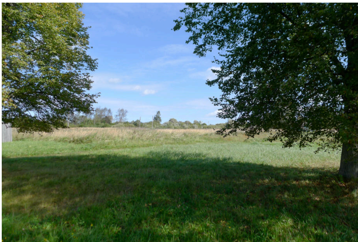
Фото 2. Место церкви – открытая возвышенность за деревьями. Вид со стороны ул. Центральной.