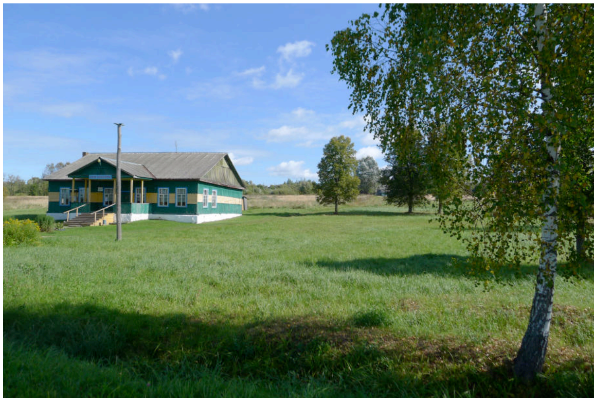
Фото 1. Место церкви – в середине кадра, за Домом культуры. Вид с дороги по ул. Центральной.