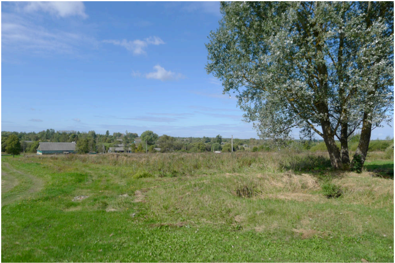
Фото 3. Вид места церкви с юго-востока, от ул. Кузнецовка.